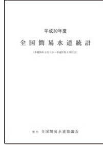
全国簡易水道統計