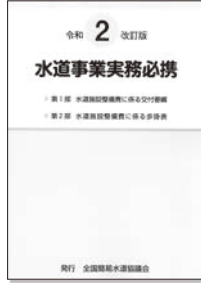
水道事業実務必携