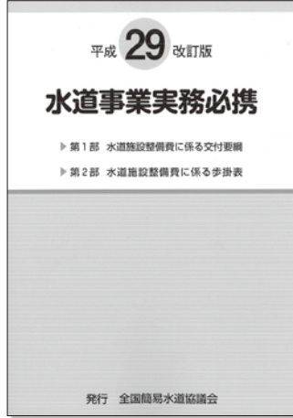
『水道事業実務必携』