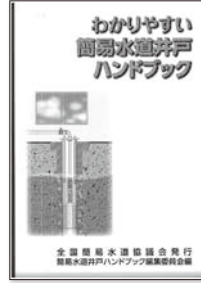
わかりやすい簡易水道井戸ハンドブック