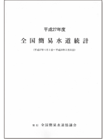
『全国簡易水道統計』