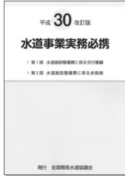
「水道事業実務必携」