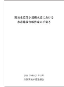
簡易水道等小規模水道における水道施設台帳作成の手引き